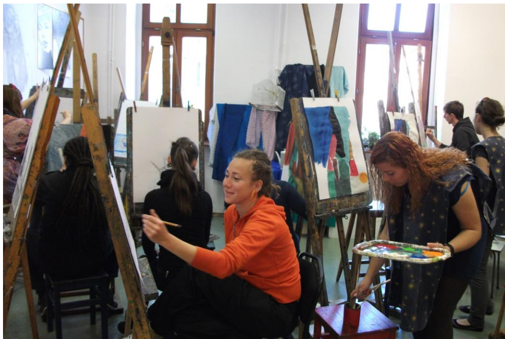
zajęcia w pracowni

Uczestnicy zajęć to wielokrotni zwycięzcy konkursów plastycznych ogólnopolskich, wojewódzkich, dolnośląskich a także zagranicznych.